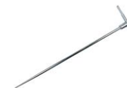
Erdspieß 80 cm