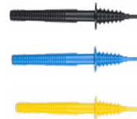
Tastsonde 1 kV (Bananenbuchse) schwarz / blau / gelb