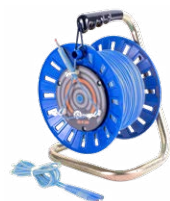
Prüfleitung auf Spule blau 75 m / 100 m / 200 m

WAPRZ075REBBSZ WAPRZ100REBBSZ WAPRZ200REBBSZ