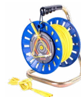
Prüfleitung auf Spule gelb 75 m / 100 m / 200 m

WAPRZ075BUBBSZ WAPRZ100BUBBSZ WAPRZ200BUBBSZ