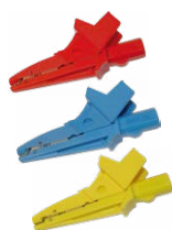
Krokodilklemme 1 kV 20 A rot / blau / gelb