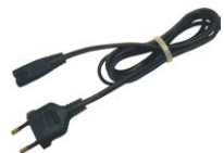
230 V Netzkabel (IEC C7 Stecker)