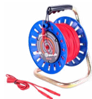
Prüfleitung auf Spule rot 75 m / 100 m / 200 m

WAPRZ075REBBSZ WAPRZ100REBBSZ WAPRZ200REBBSZ