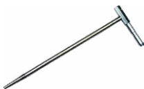
2x Erdspieß (30 cm)