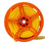
Prüfleitung 50 m auf Spule (Bananenstecker) gelb