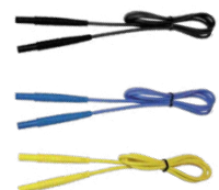
Kabel 1,2 m (Bananenstecker) schwarz / blau / gelb